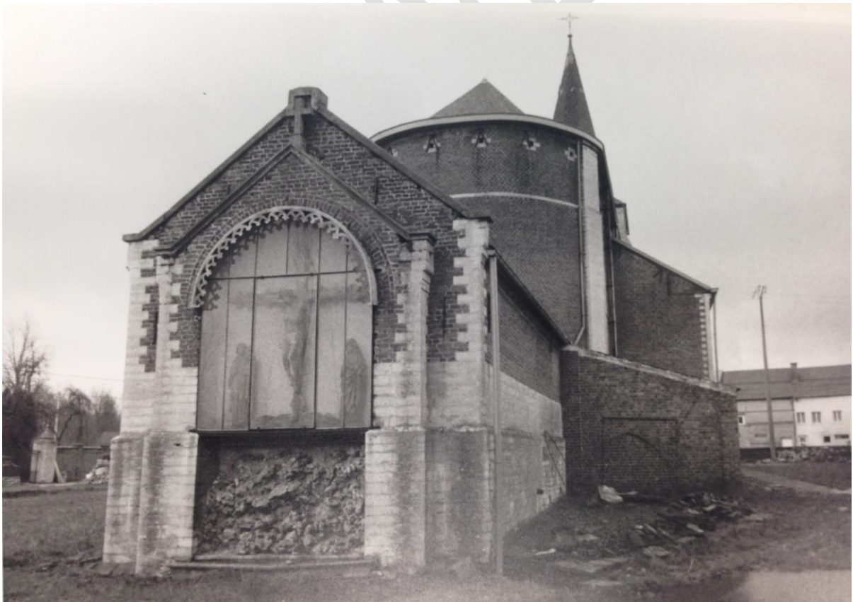
Afbeelding 3. Zicht op de nog intacte calvarie. Rechts werd later het betonnen volume aangebouwd