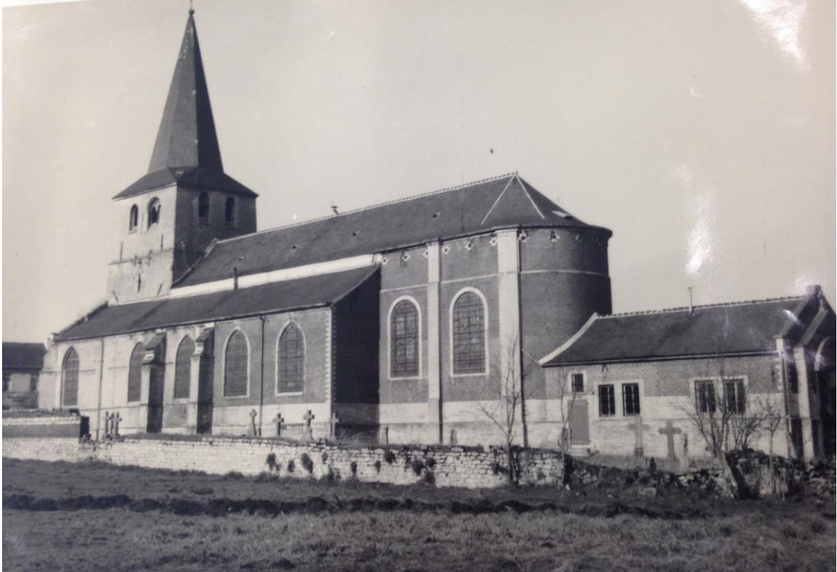
Afbeelding 2. Zicht op de kerk, 12.10.1981