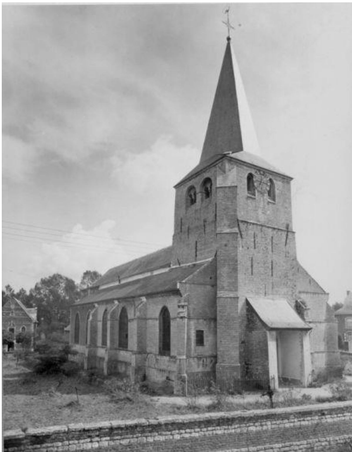
Afbeelding 1: Sint-Ermelindiskerk, 1944 - bron: balat.kikirpa.be.