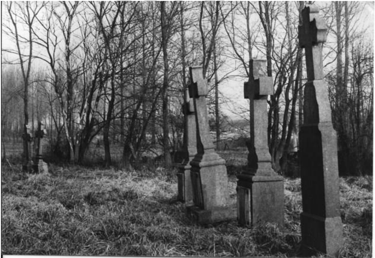
Afbeelding 5: Hardstenen grafkruisen in de zuidoostelijke zone van het kerkhof