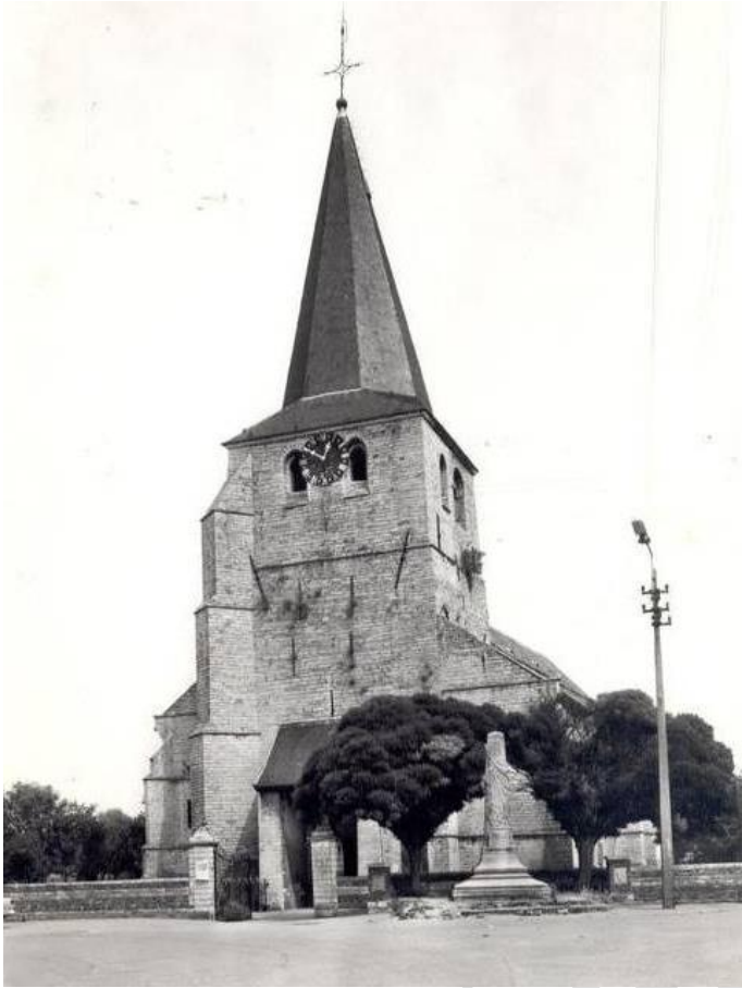
Afbeelding 4. Vooraanzicht van de kerk circa 1950 (?)